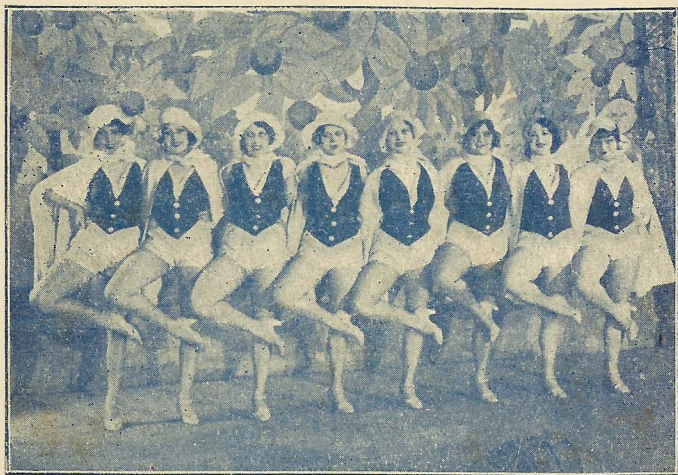
Zespół girls „Wesołego Wieczoru“.